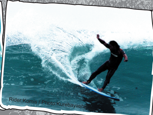
Rider: Komis