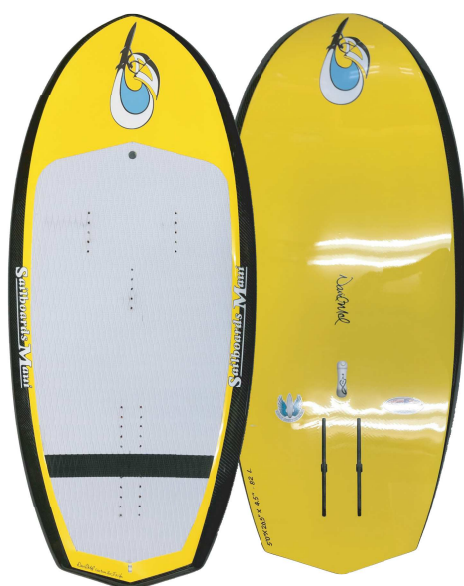
5' 0 × 26.5" × 4.5" 82L FLAT TAIL MODEL

MAUI の老舗 Silboards Maui でデザイン製作し日本へ空輸します。納期は正式オーダーから 2 - 3 ヶ月掛かります。デザインとシェープは、Sailboard Maui の Dave Mel が担当し、製作も Dave の Maui 島の工場で作成完成して輸入します。すべてフルカスタムの Dave お得意の EVAS (バキュームサンドイッチオールカーボンボード) です。Dave Mel は、バキュームサンドイッチボードの第一人者です。すべて最高の工法と技術で最高の材料で製作されるボードは WING FOIL BOARD に要求される、軽量で高強度、パンピングなどのレスポンス、耐久性を備えています。ALL MAKE IN THE U. S. A. のボードをお楽しみください。日本用にデザインされた微風から扱いやすく、加速しやすいヨーロッパスタイルの FLAT TAIL MODEL と大きくテイルがアップしている荒れた海面でも扱いやすい UP TAIL MODEL と 2 種類のデザインがあります。どちらも、お客様の希望サイズとカラーで最高の WING FOIL ボードを製作いたします。