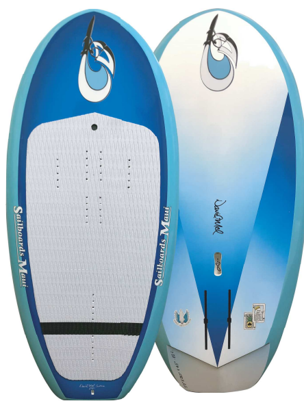
5' 0 × 26.5" × 4.5" 82L UP TAIL MODEL