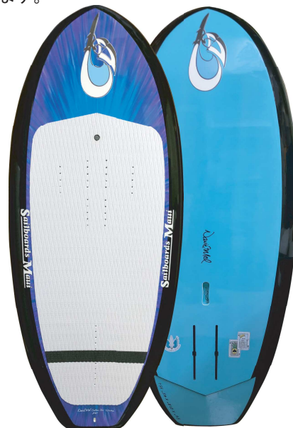
5' 6 × 27.8" × 4.5" 95L UP TAIL MODEL

注意、写真のボードには、オプションのカラーデザインが含まれています。基本価格は単色カラーと成ります。大きな為替価格の変動等により、価格が変更になる場合があります。